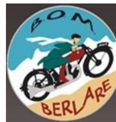
Een stukje catalogus uit de oude doos

Pneumatiques. — Quand il n'est pas spécifié d'autres marques, Hutchinson antidérapants à chapes fortes 650x55 m/m. Chambres interrompues Hutchinson.